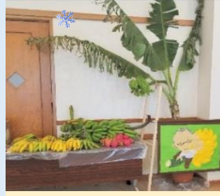
●上田前理事長のバナナも飾って