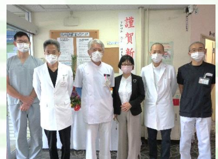
2022年1月4日 ロビーにて