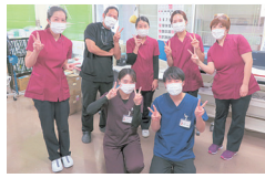
病棟の看護師と一緒に