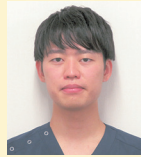
横浜栄共済病院 Dr A.Y 【研修期間】 2023/11/13～ 12/10