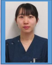
横浜栄共済 病院 Dr K,M